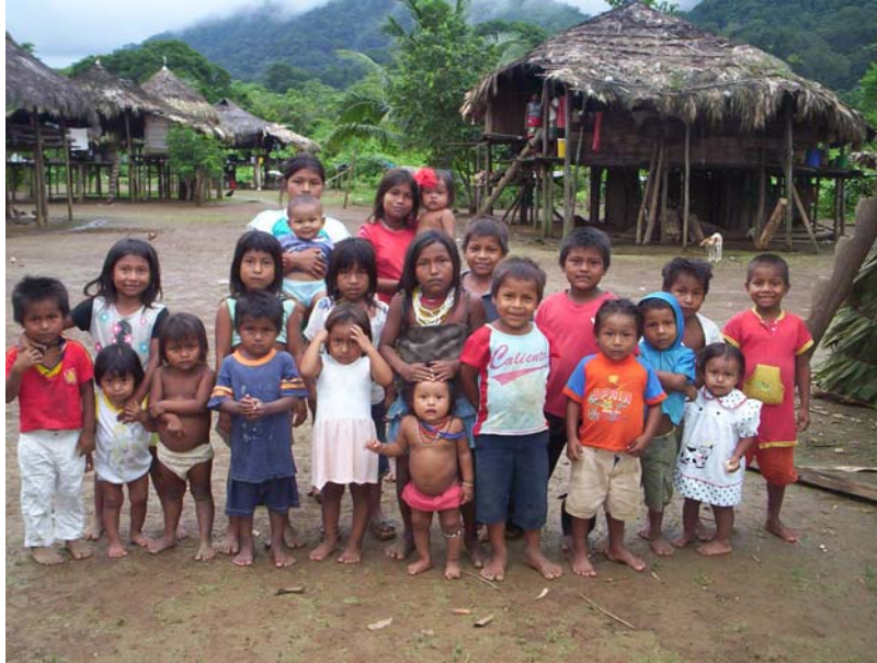
Foto KESS, 2005 : Niños de la comunidad de Peñita, en el río Jaqué. Varios de ellos vinieron por el camino o trocha, a través del bosque tropical, desde el río Jampavadó y Juradó, del departamento del Chocó, en Colombia. La travesía fue de, aproximadamente, dos días.